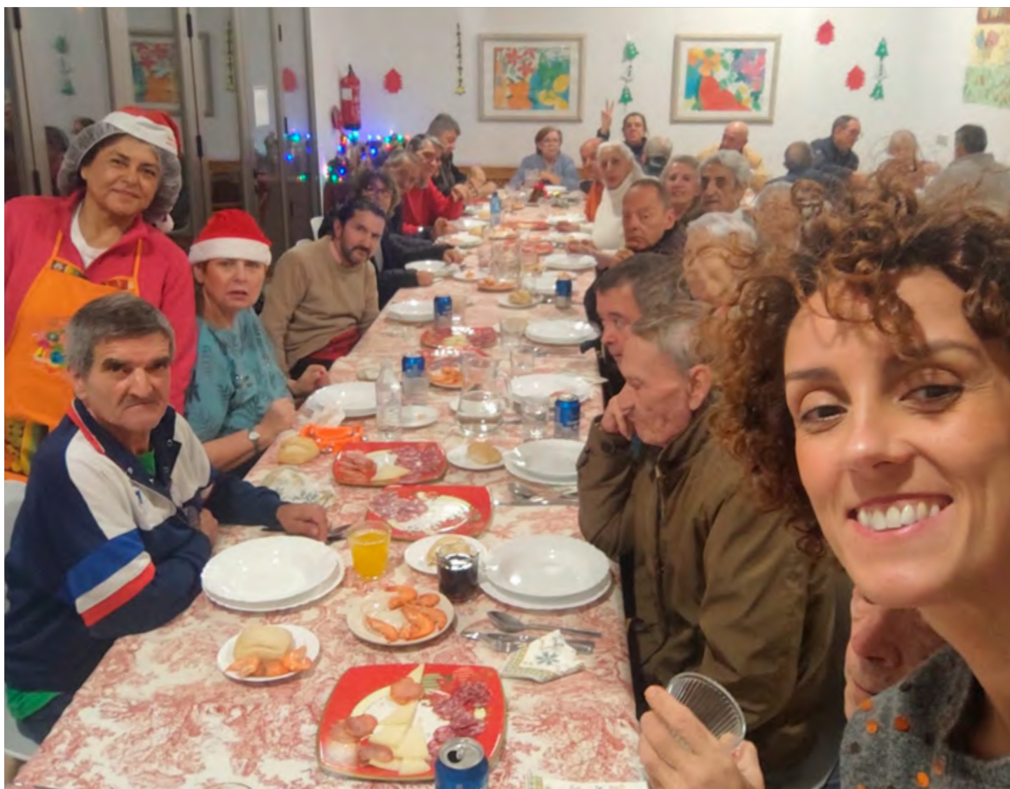
CÁRITAS DIOCESANA DE CÓRDOBA