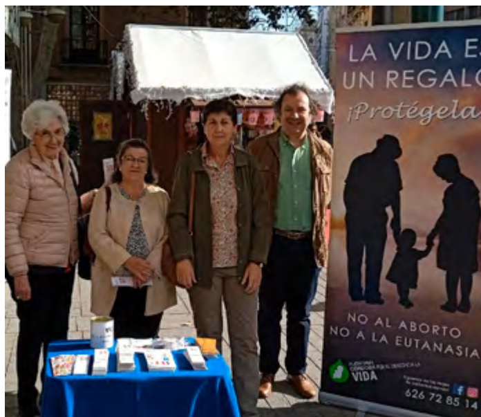
PLATAFORMA "CÓRDOBA POR EL DERECHO A LA VIDA"

Con esta iniciativa, anunciaron también que seguirán asistiendo a la puerta de la clínica de abortos de Córdoba, como vienen haciendo desde el 30 de abril del 2018, "para defender la vida de esos seres humanos concebidos