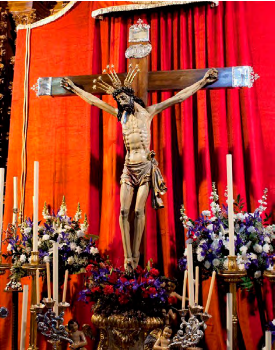
AGrupación de Hermandades y Cofradías de Córdoba

El piadoso acto se celebrará al inicio de la Cuaresma, concretamente el día 8 de marzo