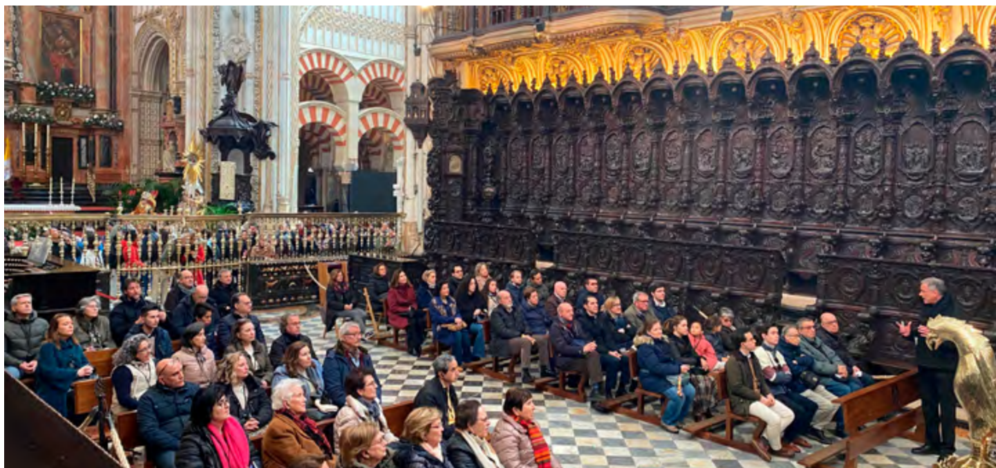
SECRETARIADO DIOCESANO DE PATRIMONIO Y CULTURA