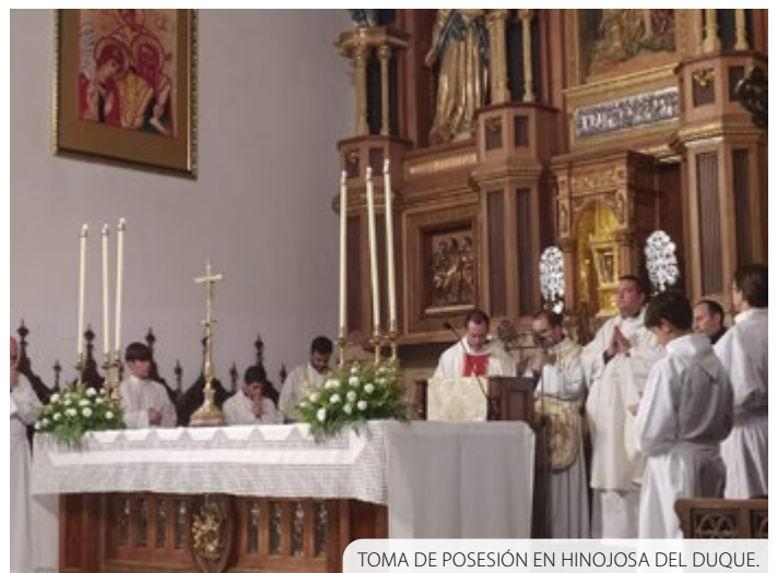
TOMA DE POSESIÓN EN HINOJOSA DEL DUQUE.