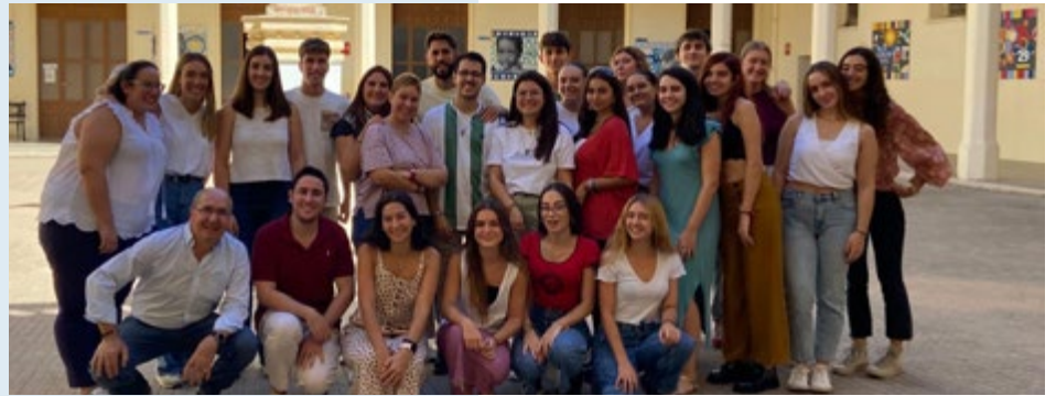
RETIRO DE CATEQUISTAS DEL MOVIMIENTO ESCOLAPIAS CORDARE DE LOS COLEGIOS SANTA VICTORIA Y CALASANCIO.