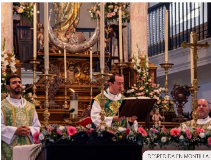
DESPEDIDA EN MONTILLA.