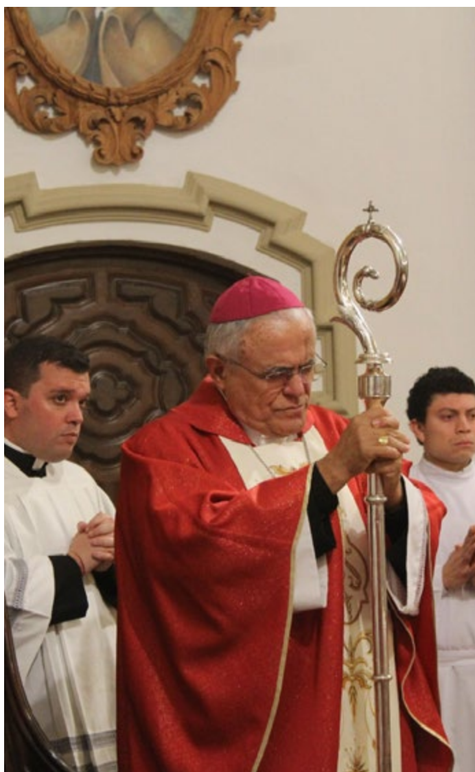
SEMINARIO SAN PELAGIO

Precisamente de su ministerio en Córdoba ha hablado en diversas ocasiones para poner de manifiesto que se siente feliz y muy agradecido de estar en una "Diócesis muy viva". El prelado se siente agradecido a Jesucristo por haberle llamado a la vocación sacerdotal y asegura que "siempre lo ha tratado muy bien" y que siente a la diócesis de Córdoba muy cerca de su Obispo. Así lo ha manifestado en reiteradas ocasiones y, más aún, en este día tan especial en el que Monseñor Demetrio Fernández cumplía un año más de consagración episcopal dando gracias a Dios por haberle dado tanto y por ponerle en su camino a la diócesis de Córdoba.