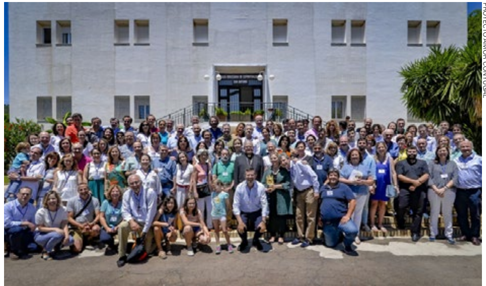
PROYECTO AMOR CONYUGAL

El plazo de inscripción permanecerá abierto desde el lunes, 9 de enero, a las 20:00 horas, a través del siguiente enlace: proyectoamorconyugal.es/retiro-matrimonios-cordoba-10-12-febrero-de-2023/ .