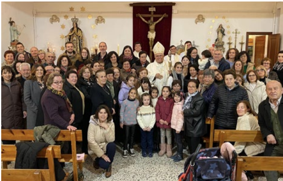
P. DEL CARMEN - LAS LAGUNILLAS

Monseñor Demetrio Fernández continúa su recorrido por el arciprestazgo de Priego de Córdoba